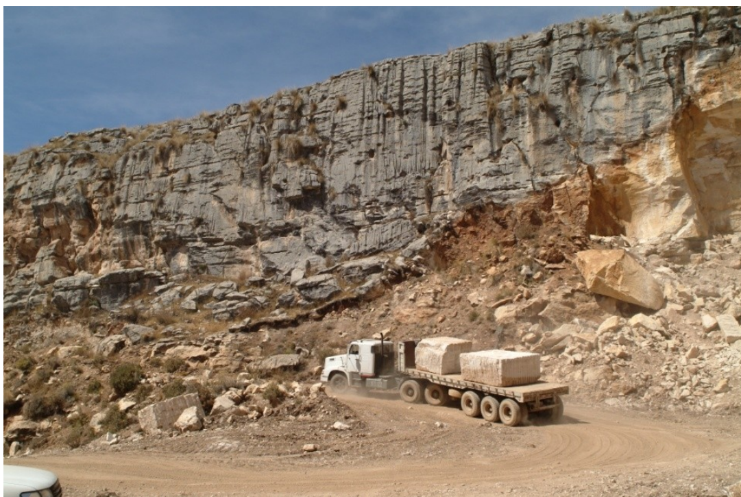
Tipo de camiones que pasarán por el centro de Arbuniel, si se aprueba la cantera

© Diario EL PAÍS S.L. - Miguel Yuste 40 - 28037 Madrid [España] - Tel. 91 337 8200 © Prisacom S.A. - Ribera del Sena, S/N - Edificio APOT - Madrid [España] - Tel. 91 353 7900