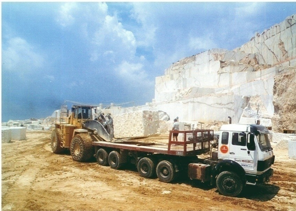
Novelda - España