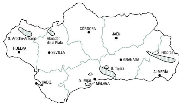
Mapa 2. Yacimientos de mármol en Andalucía.