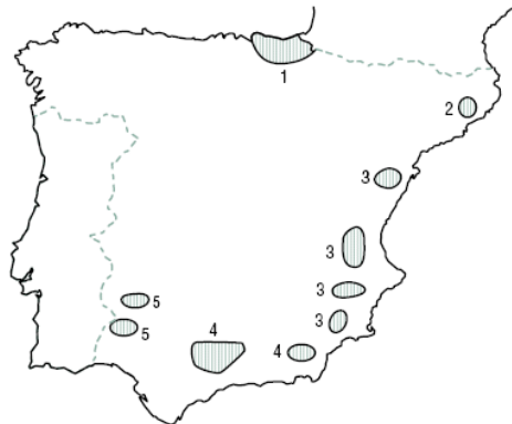
Mapa 1. Principales zonas mármreas españolas.